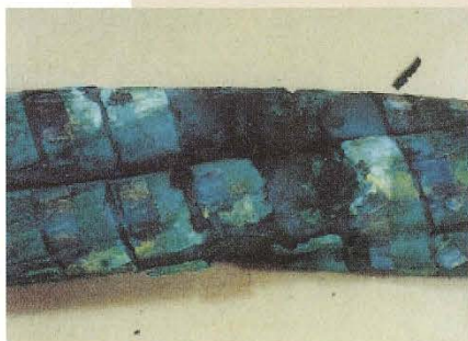
遮へい銅テープの腐食・破断

高圧CVケーブルの代表的劣化形態として、水トリー劣化、遮へい銅テープ破断、熱劣化、化学的損傷・劣化等ありますが、上グラフからも判るように、特に水トリー、遮へい銅テープ破断による自然劣化が原因でおこる波及事故が毎年多数発生しています。