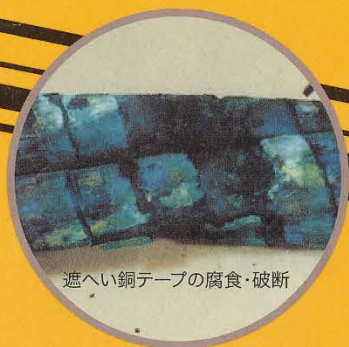
遮へい銅テープの腐食・破断